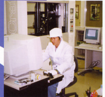
△ムービングプローブテスター