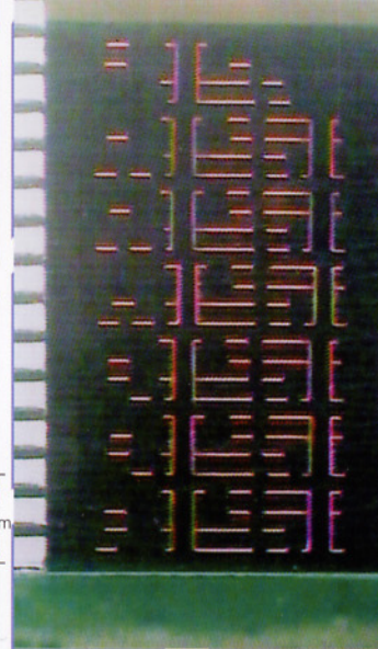
△ 30 \mu IVH